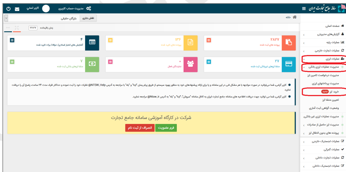
شکل ۱- نحوه ورود به بخش خرید ارز

خرید ارز قابلیت جدیدی در سامانه جامع تجارت است که به بازرگانان محترم این امکان را می‌دهد که درخواست خرید ارز (حواله) خود را به صورت سیستمی به تمام صرافی‌های مجاز ارائه دهند و پس از دریافت پیشنهادها، بهترین پیشنهاد را انتخاب و معامله خود را تا مرحله تأیید وصول حواله، پیگیری نمایند. خرید ارز فقط برای تأمین ارز در ثبت سفارش‌های بانکی دارای گواهی ثبت آماری تأیید شده به صورت «بانکی (نیمه)» قابل استفاده است. بازرگان برای استفاده از این قابلیت، باید پس از انجام ثبت سفارش، به بانک عامل مراجعه کند. سپس بانک عامل باید نسبت به ثبت درخواست تخصیص ارز، دریافت تأیید بانک مرکزی، اخذ تعهد از واردکننده مطابق تبصره ۴ بند ۱ بخش اول مجموعه مقررات ارزی و ثبت آن در پرتال ارزی اقدام نماید. پس از طی این مراحل، بازرگان می‌تواند از طریق منوی «عملیات ارزی»، «مدیریت عملیات ارزی بانکی» گزینه «خرید ارز» را مطابق شکل ۱ انتخاب نماید.